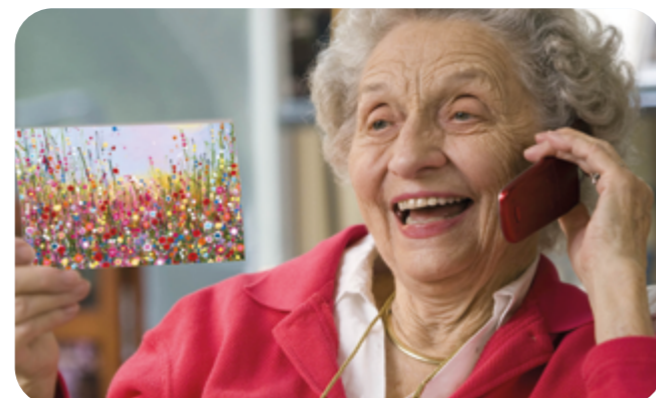
Diverse belinitiatieven in Tweckelerveld.

Woningcorporatie De Woonplaats is gestart met een bellijn speciaal voor huurders die behoefte hebben aan een praatje. Er wordt actief gebeld met de groep huurders die 75 of ouder zijn, maar natuurlijk kunt u ook gebeld worden als u dat wilt. Geef u dan op via info@dewoonplaats.nl .