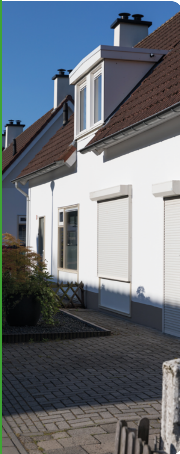
Heel Twekkelerveld moet van het gas af.