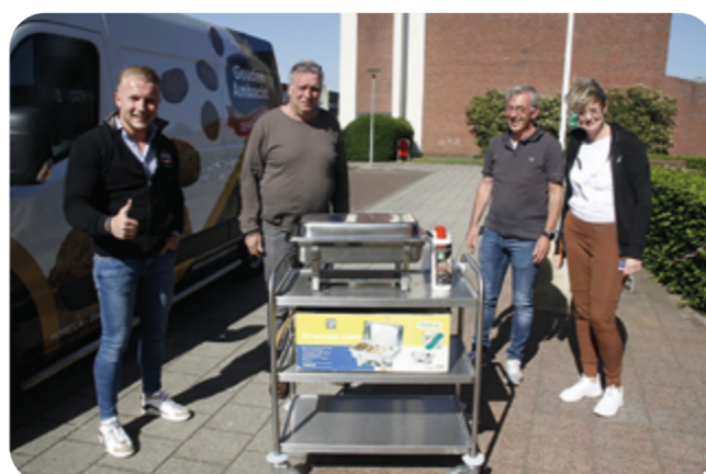
Op pad met de gehaktballen.

Veel ouderen hebben het niet makkelijk door de crisis. Een aantal mensen in de wijk zetten zich in om juist hen dat broodnodige hart onder de riem te steken. Meubelstoffeerderij A.T. Doornbos en Gouden Ambacht sloegen de handen ineen en gingen op pad om alle bewoners van Woonzorgcentrum Livio Tweckelerveld heerlijke gehaktballen mét jus te leveren. Ook de wijkbudgetcommissie zat niet stil en wilde wat extra's doen voor deze bewoners. Door de corona maatregelen kon de jaarlijkse bloemschikactiviteit met Pasen niet doorgaan. In plaats daarvan verrasten de wijkbudgetcommissie samen met Bloemsierkunst Beimer alle bewoners met een mooi bloemstukje. Een mooi gebaar, waarmee de bewoners met Pasen hun kamer toch op konden fleuren!