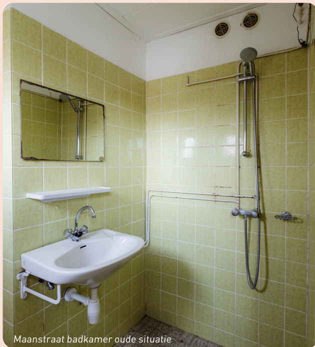
Maanstraat badkamer oude situatie