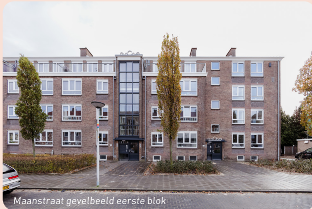
Maanstraat gevelbeeld eerste blok

Einde van de zomer werden de eerste appartementen van het eerste blok opgeleverd. Oude bewoners konden terug verhuizen en nieuwe bewoners namen hun intrek. Inmiddels is de renovatie in het tweede blok ook al vergevorderd. Een impressie in beelden!