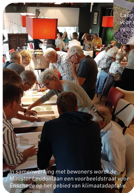
In samenwerking met bewoners wordt de Minister Loudonlaan een voorbeeldstraat voor Enschede op het gebied van klimaatadaptatie.