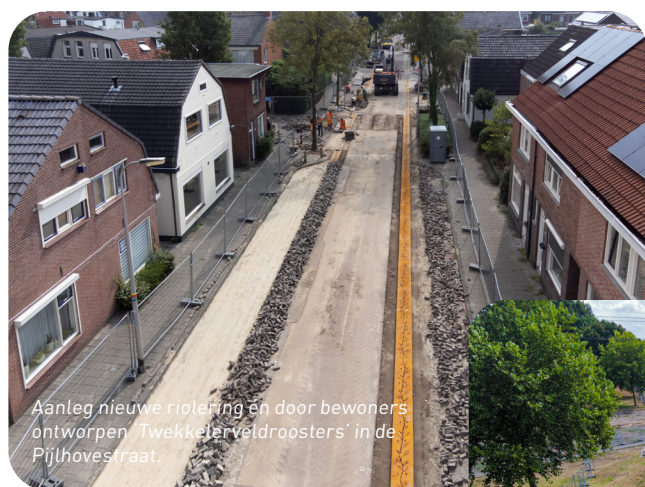
Aanleg nieuwe rioleering en door bewoners ontworpen 'Tweckelerveldroosters' in de Pijlhovestraat.

We hebben in 2022 het nodige gedaan. Dat kunnen we vertellen, maar ook laten zien! Op de foto's zie je een selectie van de activiteiten.