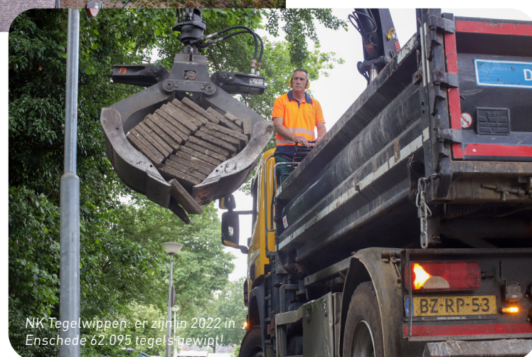
NIK Tegelwippen: er zijn in 2022 in Enschede 62.095 tegels gewipt!