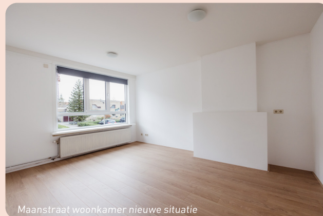
Maanstraat woonkamer nieuwe situatie