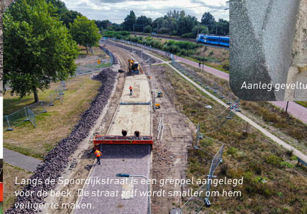
Langs de Spoordijkstraat is een greppel aangelegd voor de beek. De straat zelf wordt smaller om hem veilig(er) te maken.