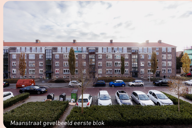
Maanstraat gevelbeeld eerste blok