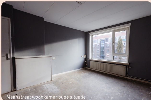
Maanstraat woonkamer oude situatie