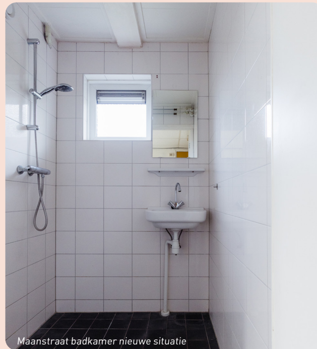
Maanstraat badkamer nieuwe situatie